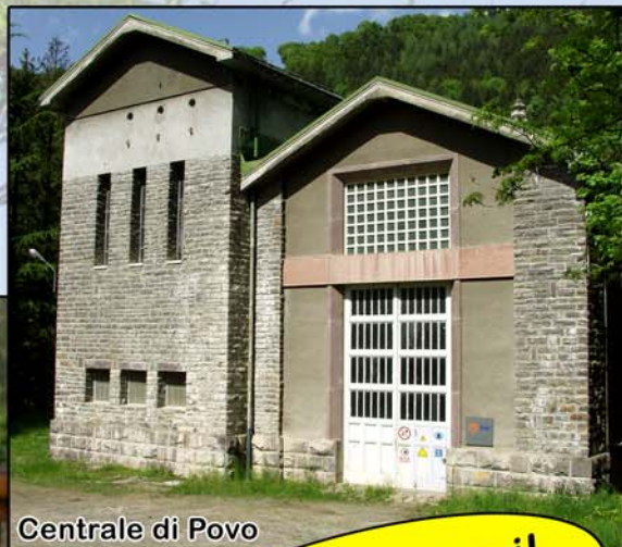
Centrale di Povo

Fraz. Pezzolo - Loc. Rocolo, 3 24020 Vilminore di Scalve (BG) Tel. 0346 51707 Fax 0346 50105