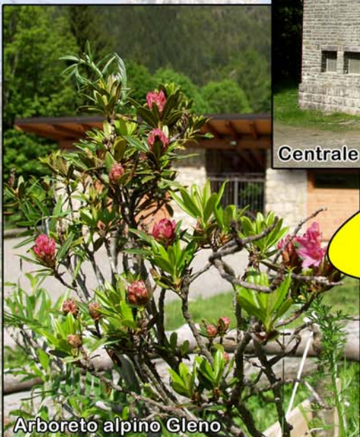
Arboreto alpino Gleno

Iscrizioni e informazioni presso la Pro Loco 0346 51002