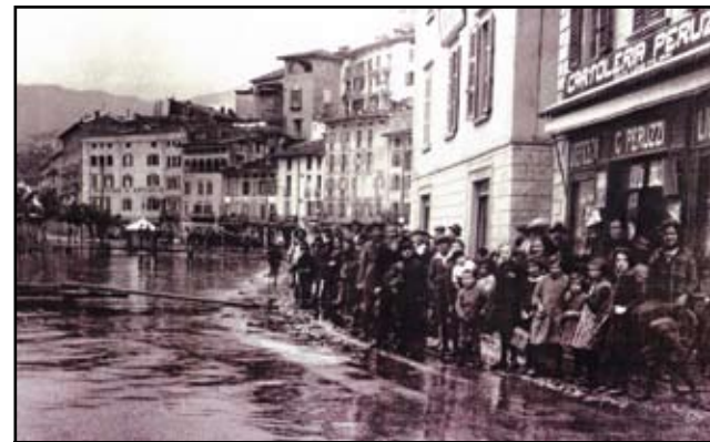
Lovere 1 dicembre 1923 - Arriva l'acqua del Gleno